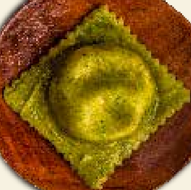
RAVIOLLE DE QUEIJO