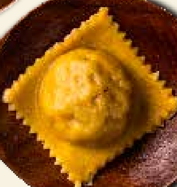
TORTELLE DE ABÓBORA